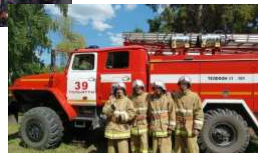
Городские соревнования «Школа безопасности»