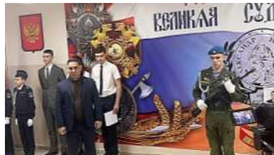
Открытие доски памяти выпускнику МБУ «Школа № 84», погибшему в СВО