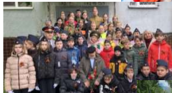
Акция «Парад идет к ветерану»