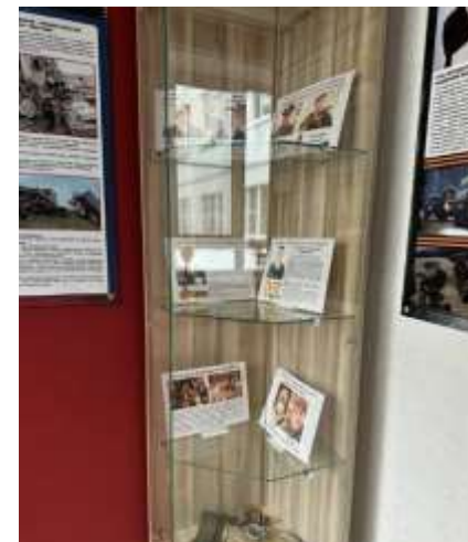
МБУ «Школа № 90»

МБУ «Гимназия № 48», МБУ «Школа № 86», МБУ «Школа № 84»