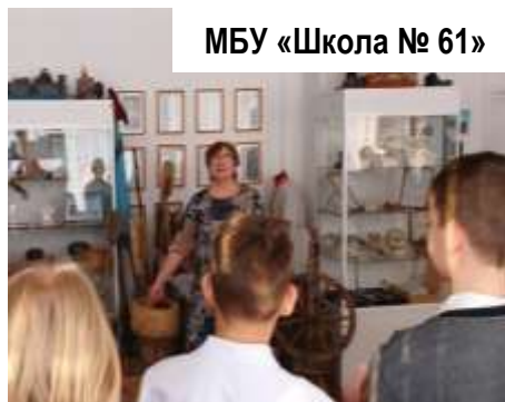
МБУ «Школа № 61»