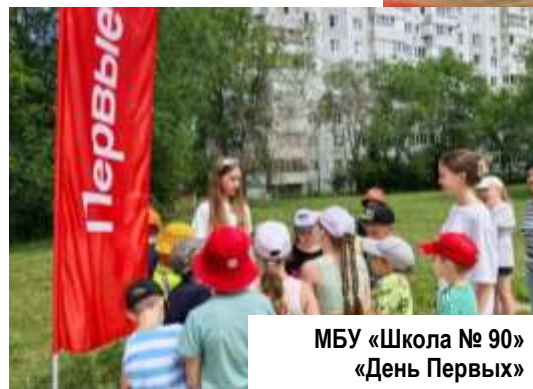
МБУ «Школа № 90» «День Первых»