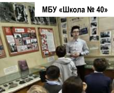
МБУ «Школа № 40»