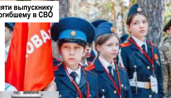
Военно-спортивная игра «Зарница 2.0»