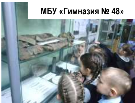
МБУ «Гимназия № 48»