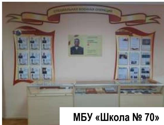
МБУ «Школа № 70»

МБУ «Гимназия № 35», МБУ «Школа № 86», МБУ «Лицей № 19», МБУ «Школа № 47», МБУ «Гимназия № 48»