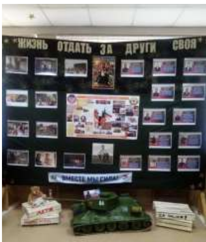
МБУ «Школа № 84»