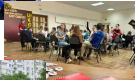
МБУ «Школа № 1» Игра «Наш родной край»