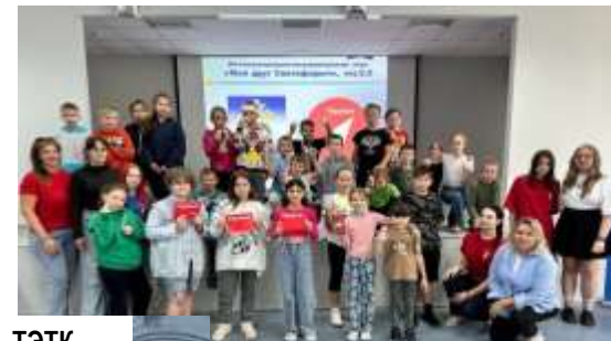
МБУ №№ 51, 80, «Галактика», ТЭТК «День Памяти и скорби»

Военно-патриотические клубы созданы на базе ОО (ВПК «ФорПост», ВПК «Крылатая гвардия», ВПК «Витязь», ВПК «Рать» и др.)