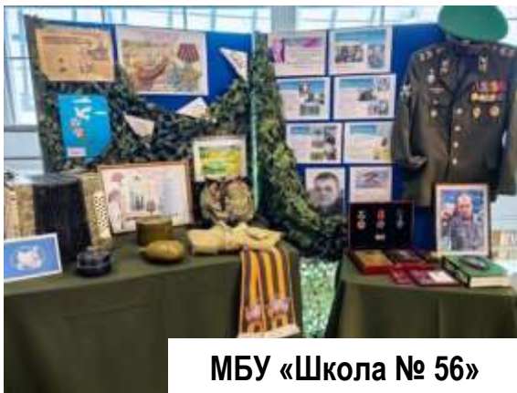
МБУ «Школа № 56»