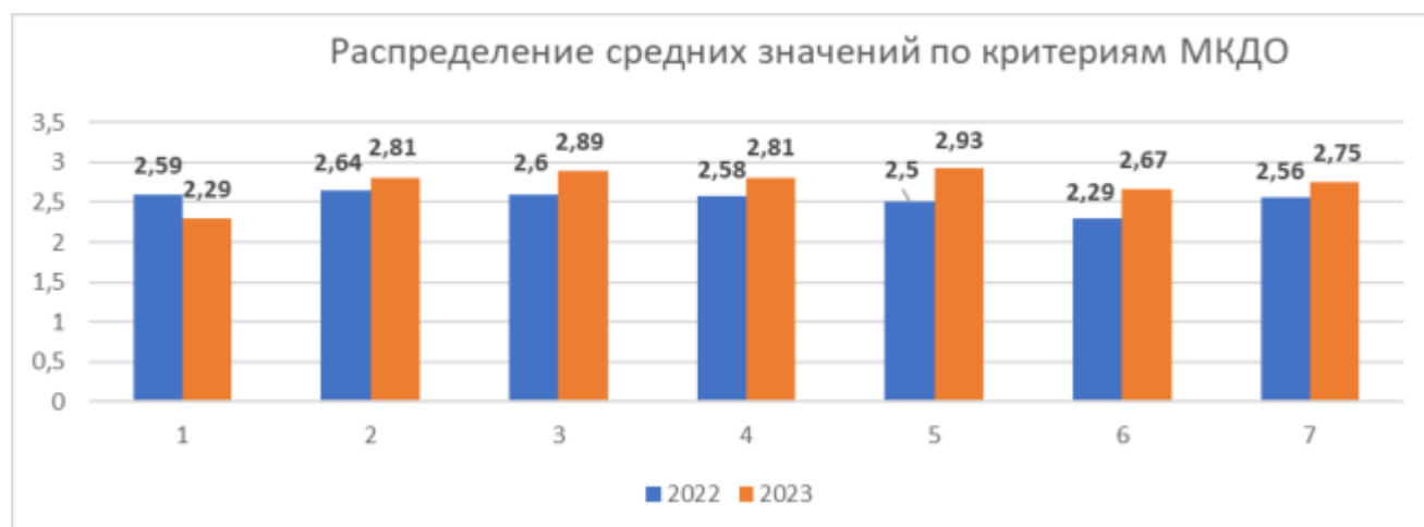
Обозначения критериев МКДО

По итогам количественного и качественного анализа результатов мониторинга МКДО установлено, что муниципальная система дошкольного образования городского округа Тольятти функционирует на высоком уровне, среднее значение – 2,74 балла, что превосходит показатель 2022 года на 0,20 балла (среднее значение – 2,54 балла).